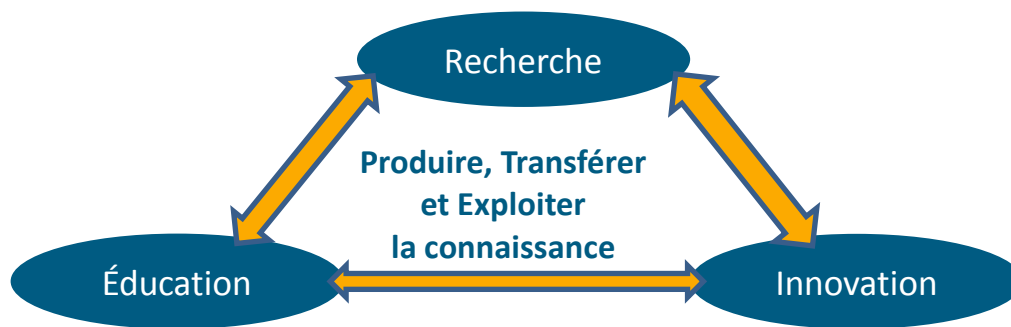
Schéma 2 : Triangle de la Connaissance

Le principal résultat de cet état de l'art détermine le fait que les PME ont des besoins en lien avec les normes et la normalisation, mais qu'il est souvent difficile de les identifier. En effet, certains besoins sont considérés comme non prioritaires pour les PME, en raison de la conjoncture économique.